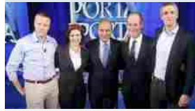
Zaia-Moretti, battaglia da Vespa Sul Mose è fuoco incrociato