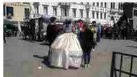
Racket delle maschere a San Marco: mance pretese con forza per le foto