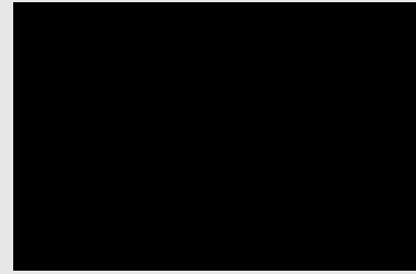
GATTI ALL'ATTACCO - La reazione di questi gatti è adorabile...