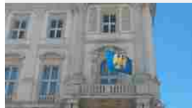
L'aquila gialla del Friuli arriva in Piazza Unità: proteste sul web